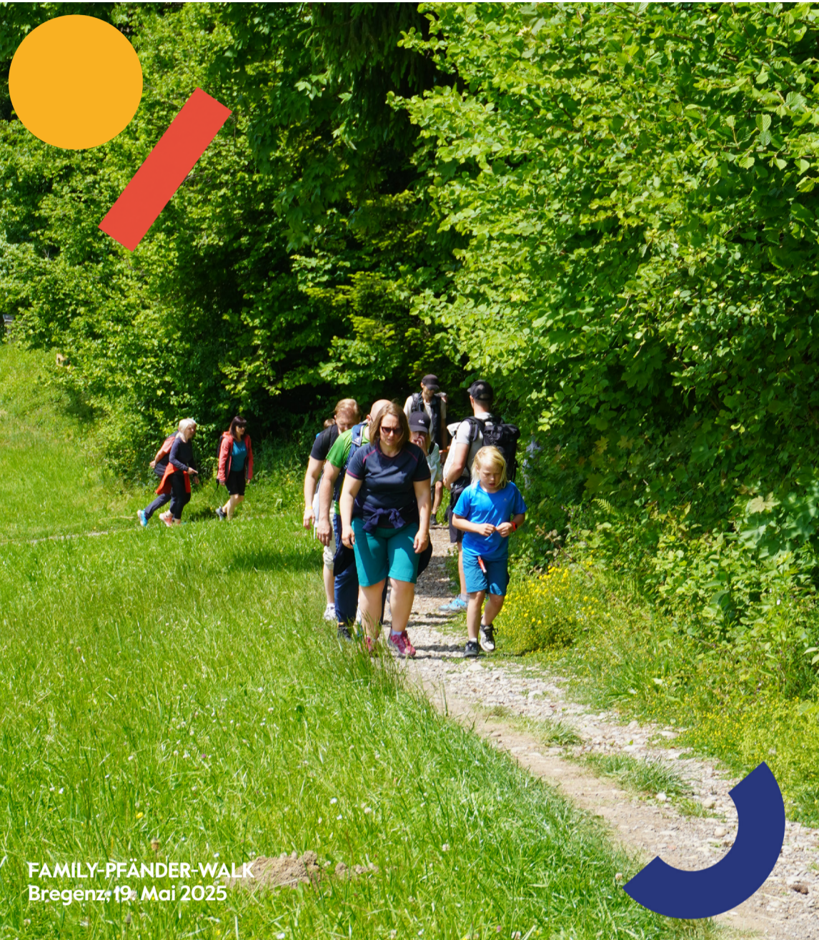
FAMILY-PFÄNDER-WALK Bregenz, 19. Mai 2025